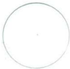
BLANC RAL 9010