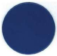
BLEU SAPHIR RAL 5002