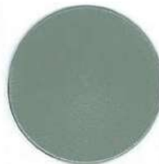
GRIS RAL 9006