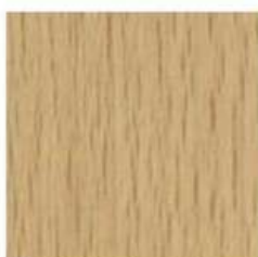
HETRE DE TOLEDE