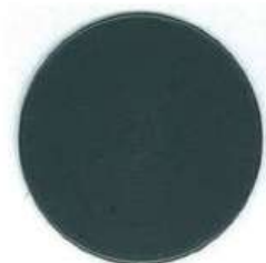
GRIS RAL 7015