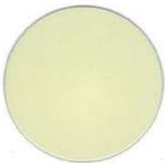
BEIGE RAL 1015