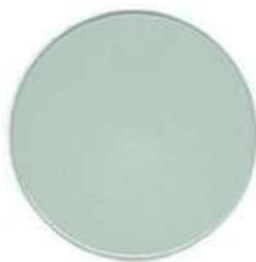
NUAGE RAL 7035