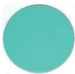
VERT RAL 6027