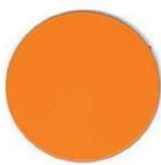
MELON RAL 2003